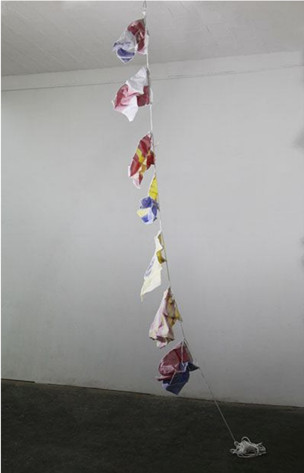
Sophia Pompéry, Halcyonic Days , 2014