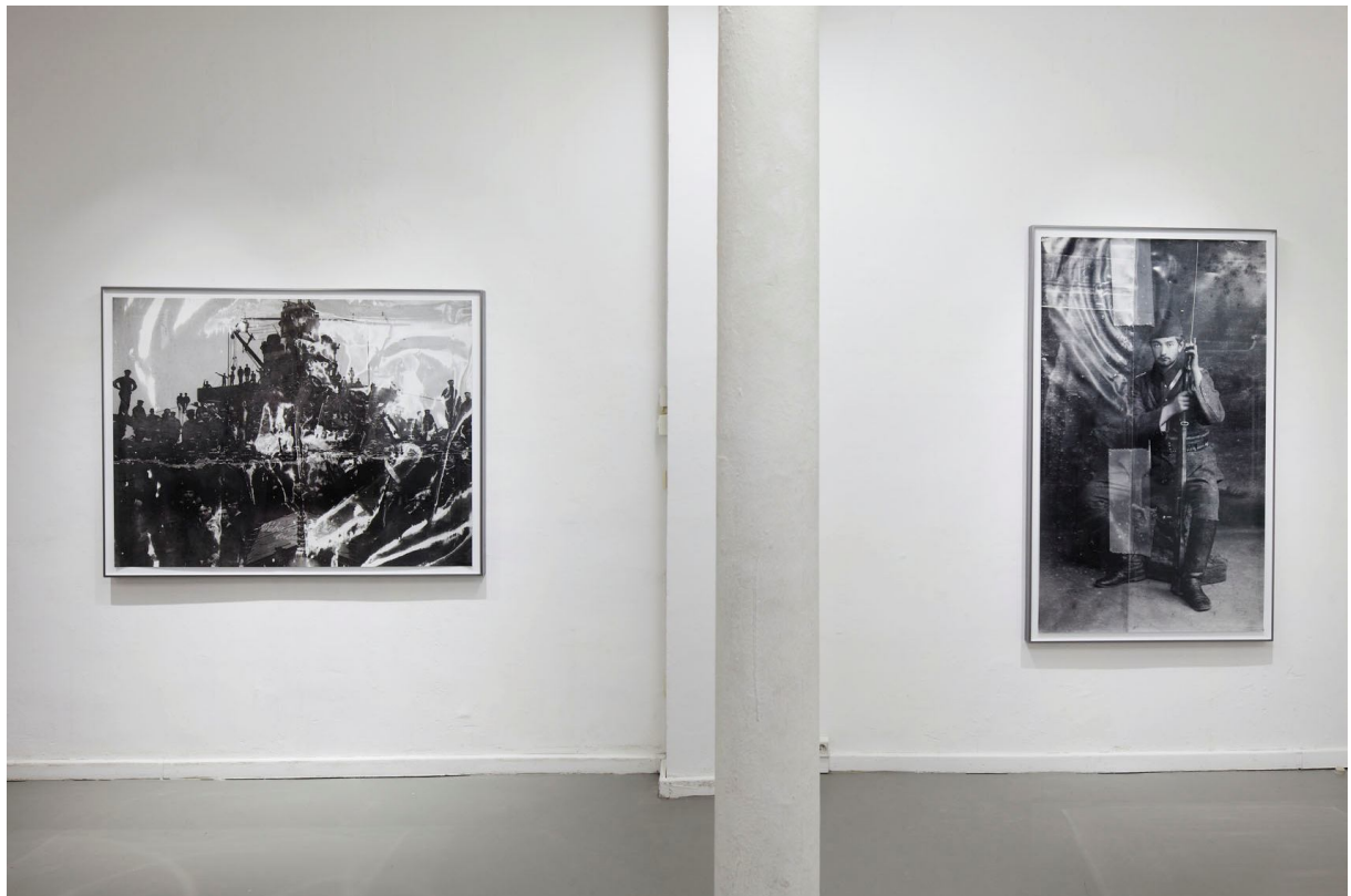
Sebastian Riemer, vue d'installation