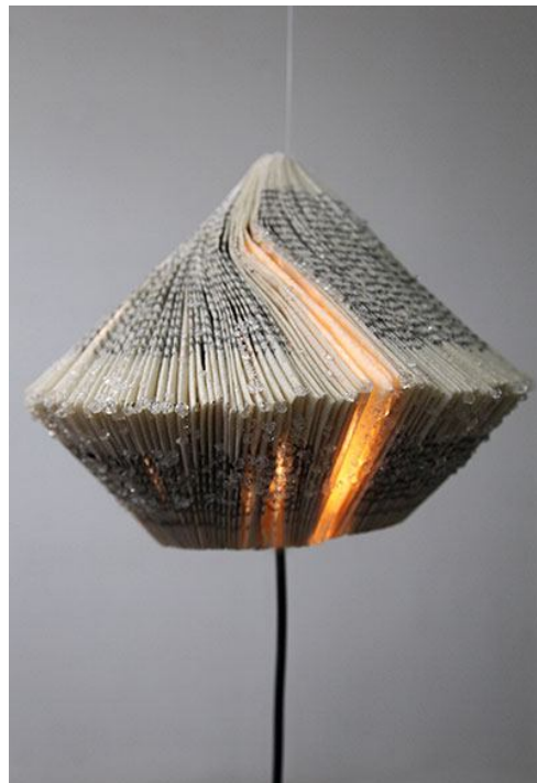
Sophia Pompéry, Light Buoy , 2014